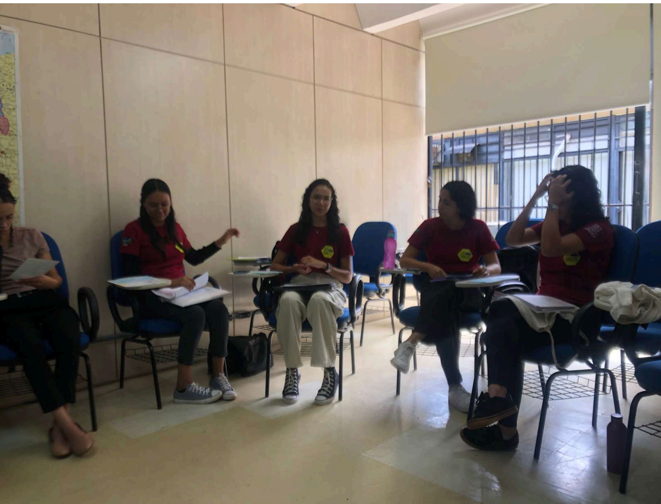
Extensionistas pariticipantes do mini curso do projeto