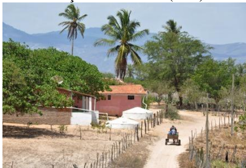
Figura 1 - Cisternas com capacidade para 16 mil litros do Programa Um Milhão de Cisternas (P1MC), da Articulação no Semiárido (ASA).