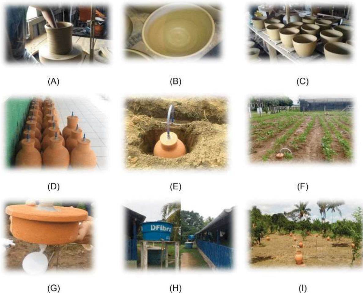
Figura 1: Imagens indicando o processo de fabricação dos potes pelo artesão em Icoaraci (A, B, V), os potes prontos para serem instalados no solo (D), o cano de borracha conectado na tampa do pote de cerâmica que evidencia a ligação da água entre os canos (PVC) enterrados no solo (E), instalação de um sistema de irrigação para compartilhar a tecnologias à estudantes de agronomia no estado do Pará (F) como o sistema é conectado na tampa dos potes (G), sistema de coleta de água da água em caixa d'água (H) e distribuição dos potes durante a instalação da Unidade Demonstrativa (UD) na comunidade de Lavras, em Santarém, Pará.

O IrrigaPote utiliza materiais simples e de baixo custo na implementação do sistema, apresentado em forma de cartilha (MARTORANO et al., 2017), tais como: argila para fabricação dos potes, água da chuva coletada em calhas instaladas na base do telhado, dependendo da disponibilidade e interesse no controle do fluxo hídrico. Instalou-se higrômetro para contabilizar toda a água que abastece os potes, sendo o reabastecimento dos potes realizado por um sistema totalmente mecânico, apontando economia de energia na manutenção da oferta hídrica às plantas, conduzindo a água por força gravitacional até o sistema de entrada de água, controlado por boias instaladas na tampa dos potes (Figura 2).