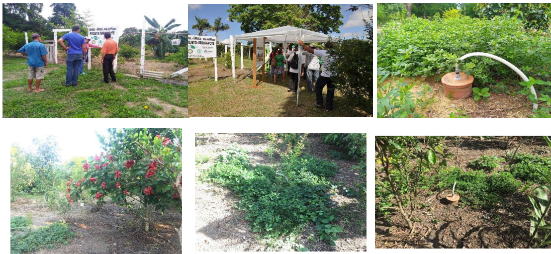
Figura 4: Exemplo de cultivos na área do projeto IrrigaPote, na comunidade de Lavras, no município de Santarém, oeste do Pará.

As plantas irrigadas pelo sistema vêm garantindo a manutenção da produção de acerola o ano todo, pois no período mais seco do ano (agosto a novembro) a venda tem sido garantida nas feiras de produtos orgânicos, juntamente pela manutenção da oferta hídrica, pela irrigação com os potes de argila. Ao avaliar indicadores, a partir de verbalizações do casal de agricultores e filhos que o Projeto IrrigaPote trouxe benefícios com a oferta hídrica às culturas, usando tecnologia simples e, de fácil adoção. Reforçam que houve aumento na renda familiar, pela diversificação e manutenção semanais das vendas nas feiras de produtos orgânicos, em Santarém. A constante oferta de produtos, vem possibilitando um planejamento anual, principalmente pela venda de frutas como acerola e maracujá doce com preços mais competitivos, no período seco na região. O casal de agricultor de base familiar rural mantém cerca de 20 culturas, em alta produção, incluindo frutíferas e outras culturas de ciclo curto. Em quatro anos do Projeto houve aumentos da ordem de 60% na renda familiar, além de ganhos sociais e ambientais.