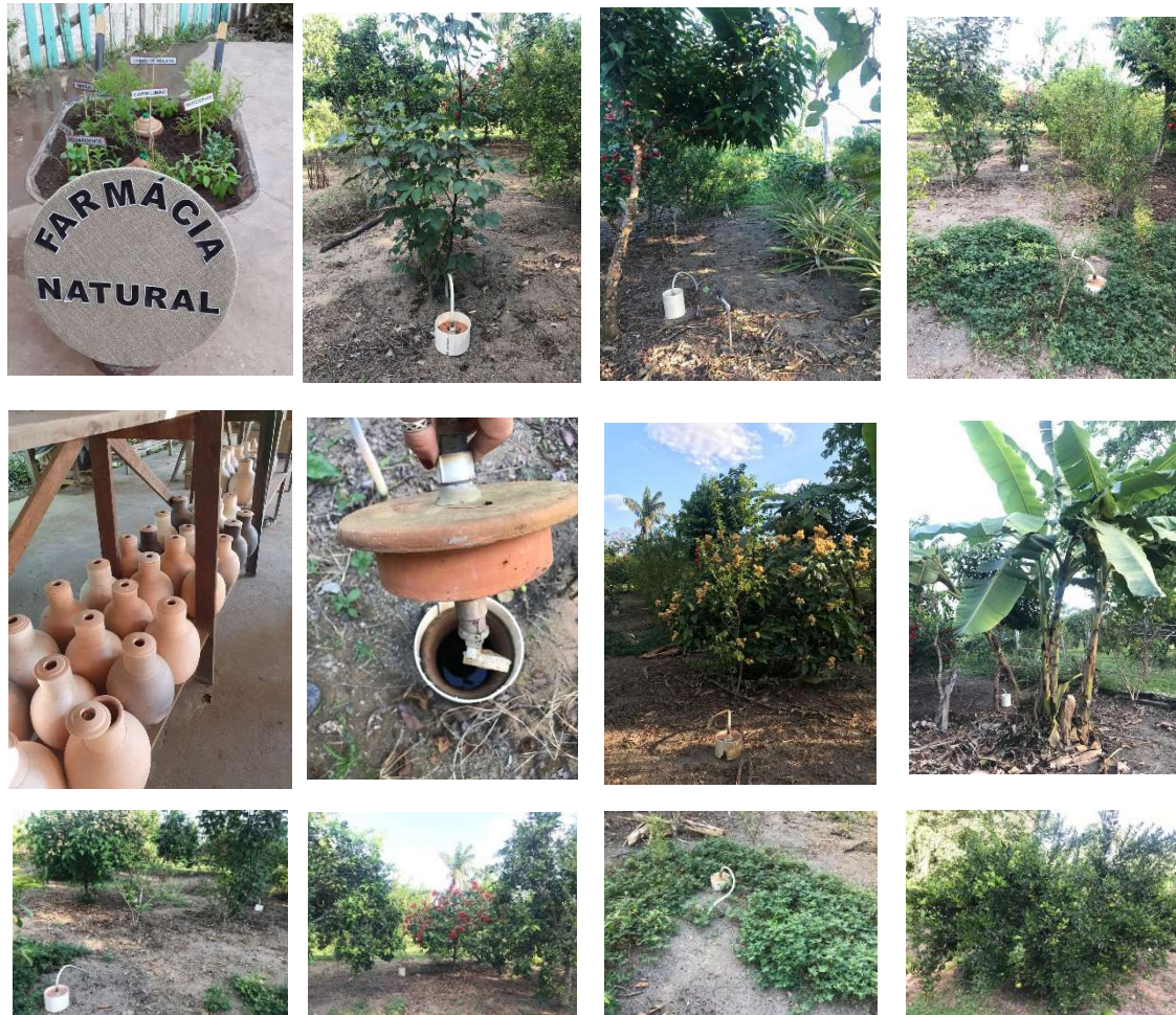
Figura 5: Exemplo de potes fabricados para atender novas demandas com IrrigaPote.

Por ser uma estratégia de baixo investimento, vislumbram-se novas oportunidades de oferta de alimentos em épocas secas, inclusive com diversificação de culturas e aumento de produção, em pequenas áreas de cultivos. O armazenamento e reuso de águas pluviais garante o suprimento hídrico mais resiliente, na agricultura. Como o processo é todo mecânico, libera tempo para o agricultor utilizar em outras atividades diárias. Os agricultores poderão se dedicar em atividades como artesanatos, educação formal e lazer. A identificação de polos ceramistas aponta oportunidades de renda à artesões em áreas com interesse de uso da agrotecnologia IrrigaPote.