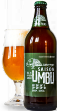
Cerveja de Umbu