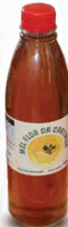
Mel de Abelha