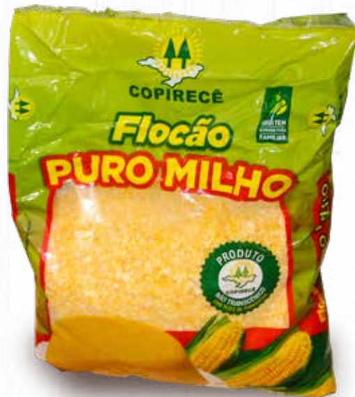
Flocão de Milho