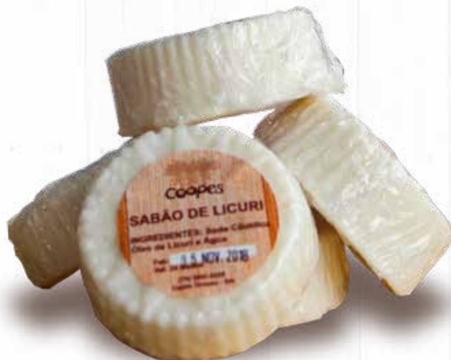
Sabão de Licuri