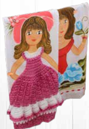
Pano de Prato