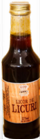
Licor de Licuri