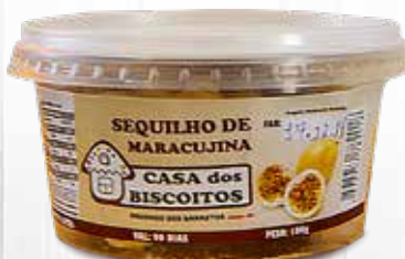
Sequilhos de Maracujina