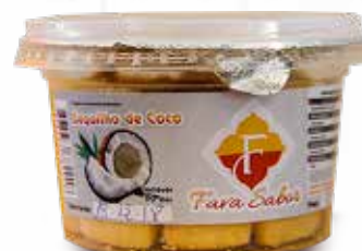
Sequilhos de Coco