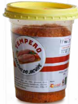
Tempero Delícias do Jacuípe