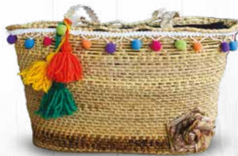
Bolsa de Palha