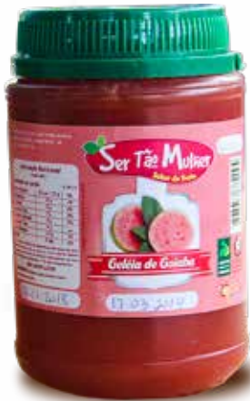
Geleia de Goiaba