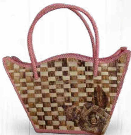
Bolsa de Palha