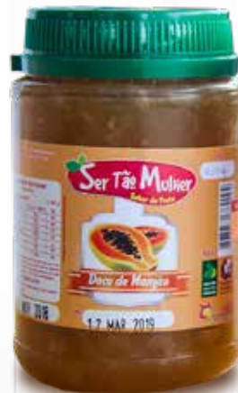
Doce de Mamão