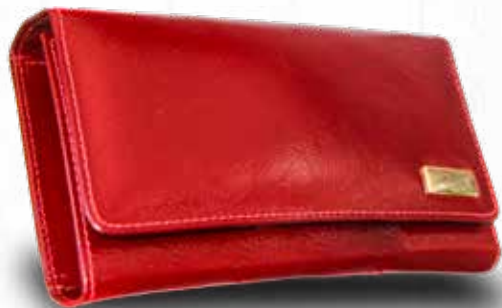
Bolsa em Couro