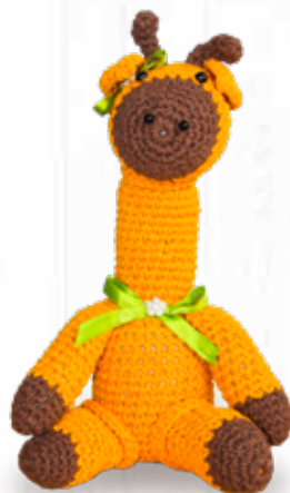
Peças decorativas em crochê