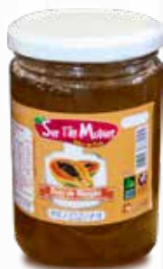
Doce de Mamão