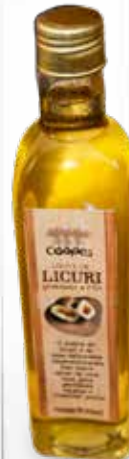
Azeite de Licuri