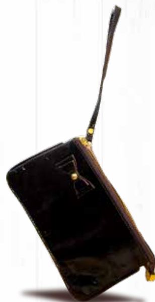
Bolsa em Couro