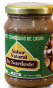
Leite Condensado de Licuri